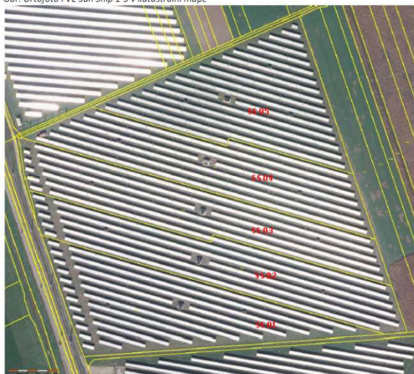
Obr. Ortofoto FVE Sun Ship 1-5 v katastrální mapě