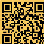
DIAGRAM IRQ Funds SICAV a.s. U měšťanského pivovaru 1417/7 170 00 Praha 7 www.diagramfund.cz

AMISTA investiční společnost, a.s. Sokolovská 700/113a, 186 00 Praha 8 amista@amista.cz +420 226 233 110 www.amista.cz