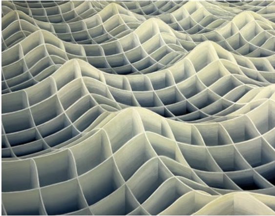
Jan Poupě, Konstrukce vlnění , 40 x 110 cm