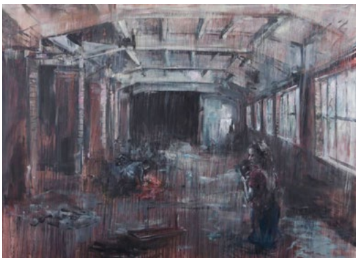
Josef Bolf, With Fire and Mask , 200x250 cm, 2017

Neméně významným nákupem bylo rozměrné dílo Josefa Bolfa (1971), obraz s názvem With Fire and Mask , z roku 2013. Josef Bolf patří k naprosto klíčovým představitelům figurální malby tzv. „Nulté generace“. V letech 1990 až 1998 vystudoval malbu na Akademii výtvarných umění v Praze pod vedením profesorů Jiřího Načeradského, Vladimíra Kokolii a Vladimíra Skrepla. Zúčastnil se několika zahraničních stipendijních pobytů např. ve Stuttgartu nebo v New Yorku. V roce 2005 byl finalistou Ceny Jindřicha Chalupického. Obrazy Josefa Bolfa jsou v současné době na trhu vysoce nedostatkovým zbožím. V posledních zhruba dvou letech došlo k razantnímu zvýšení cen autora, a to jak v aukčním, tak přímém prodeji. Zásadní zvýšení nastalo jak u prací staršího data, tak u děl z let nedávných. V loňském roce dokonce v aukci Arthouse Hejtmánek přesáhl Bolfův obraz středního formátu hranici jednoho milionu korun.