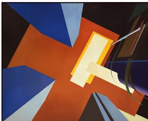
Theodor Pištěk, Dolů 2, 160 x 199,5 cm, 1996

Podařilo se nám získat dvě významná díla Theodora Pištěka (1932), momentálně nejdražšího žijícího českého malíře a zároveň jednoho z neznámějších českých umělců. Pištěk je nejen výtvarný umělec, ale také kostýmní výtvarník, scénograf a bývalý automobilový závodník. Je světově proslulým autorem filmových kostýmů a dekorací a držitelem Oscara za kostýmy k filmu Amadeus režiséra Miloše Formana. V malbě proslul zejména fotorealistickým zobrazením detailů automobilů, jejich chromovaných částí, nebo věrným zachycením běžných reálií. Neméně významná je ale i jeho tvorba inklinující ke geometrické abstrakci. V malbách prázdných schematizovaných architektur pracuje s různými druhy falešné perspektivy nebo světelného režimu. Dvě díla z tohoto období, s názvem Dolů 1 a Dolů 2, z roku 1996 se nám podařilo získat za velmi výhodnou cenu, přestože Pištěkovy obrazy jsou na trhu opravdovou vzácností.